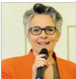
Loredana Poli assessore Comune di Bergamo