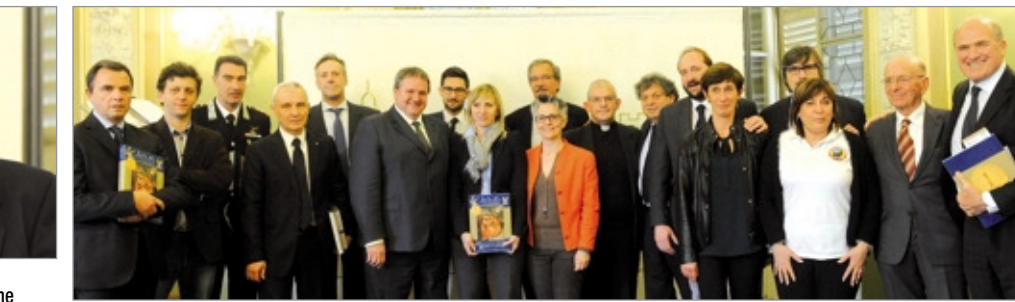
Il gruppo delle autorità e dei rappresentanti delle istituzioni cui è destinata la solidarietà 2016