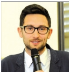
Davide Casati sindaco di Scanzorosciate