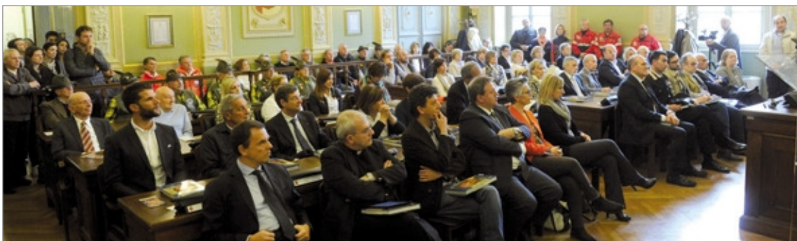
L'affollata sala del Consiglio della Provincia dove venerdì 13 maggio è avvenuta la presentazione del torneo di tennis 2016