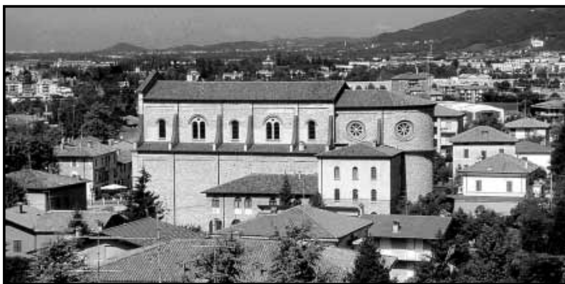
A Mozzo è nato un tavolo di lavoro sulle realtà giovanili