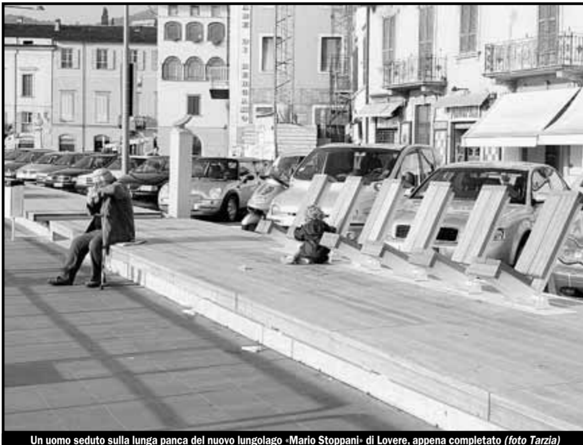
Un uomo seduto sulla lunga panca del nuovo lungolago «Mario Stoppani» di Lovere, appena completato

Durante l'autunno e l'inverno scorso, nelle fondamenta del marciapiede, lungo quasi 130 metri a sbalzo sul lago, vennero inseriti nuovi elementi in carbonio al posto del calcestruzzo, consumato dall'acqua del Sebino. Poi, durante la primavera e a settembre, la passeggiata è stata completamente rimodellata: sono sparite le vecchie aiuole, le panchine e le mattonelle rosse che caratterizzavano il marciapiede. Al loro posto è comparso una grande panca che corre per tutta la lunghezza del marciapiede, sulla quale sono state posizionate sedie sdraio, pennoni, un osservatorio sopraelevato e altri elementi che la fanno somigliare al pontile di una nave. Verso la