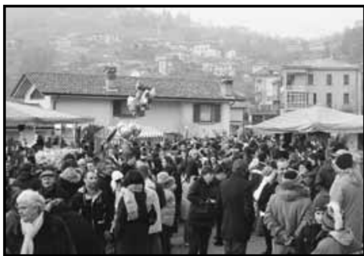
Moltissima la gente a passeggio tra le bancarelle di Bruntino

■ Un San Mauro da record quest'anno a Bruntino. La coincidenza dei festeggiamenti del santo benedettino con la domenica ha convinto più di 10 mila persone ad affrontare le colline di Bruntino chiuse al traffico per l'occasione. Le auto parcheggiate ai lati della strada arrivavano a riempire via Gnere, via Ronco Alto e la zona del municipio distanti dal santuario più di tre chilometri. La Polizia locale dell'Unione dei Comuni di Almè e Villa d'Almè, coordinata dal comandante Nicola Filippetti con il sostegno dell'associazione nazionale carabinieri in congedo, ha faticato non poco per regolare l'afflusso di gente. All'imbocco della strada che porta al santuario, in prossimità della rotonda di via degli Alpini, molti hanno dovuto attendere anche più di mezz'ora prima di poter addestrarsi tra le bancarelle «intasate» di pedoni. Coloro che non intendevano aspettare hanno optato per il sentiero secondario, senza bancarelle ma con una visuale splendida, che dalla Ca' dell'Orto aggira il santuario. La piccola chiesa dedicata a San Mauro (la statua è stata portata in