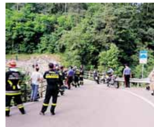
A sinistra, il burrone nel quale è precipitato il motociclista bergamasco. Sopra, la scena dell'incidente e il gruppo di soccorritori