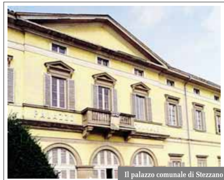
Il palazzo comunale di Stezzano

STEZZANO La vita politica di Stezzano si tinge di giallo, con sfondo verde, visto il colore dell'amministrazione. Complici voci insistenti che stanno circolando da qualche giorno nel paese dell'hinterland e un volantino anonimo. Il foglio non firmato, un formato A4 senza loghi né altri segni di riconoscimento, ma sottoscritto da un non meglio precisato «Grillo parlante», è finito tra l'altro anche all'interno della bacheca del Partito democratico di Stezzano, sottochiave. Le illazioni contenute nel testo parlano di una festa di partito tenuta qualche mese fa a Stezzano, durante la quale un volontario sarebbe stato «colto a sottrarre soldi» dall'incasso. Nel testo non si fanno nomi di persone o di gruppi, ma si scrive soltanto che la persona accusata non sarebbe un simpatizzante o un iscritto