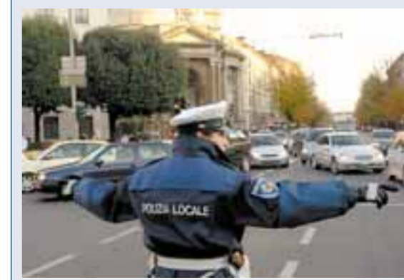
Donadoni a pagina 13