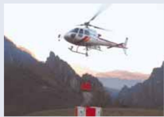
Ricci a pagina 22

■ Hanno organizzato una manifestazione per protestare contro i continui disservizi nel recapito della corrispondenza nel loro paese, Scanzorosciate: sabato un pullman dovrebbe raggiungere Milano con 50 persone - tra cui sindaco, assessori e consiglieri - per manifestare sotto gli uffici della direzione delle Poste.