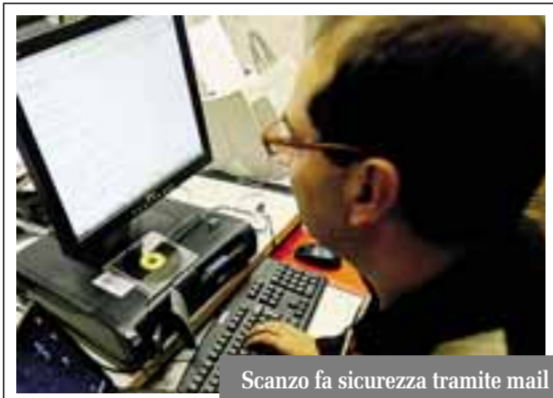
Scanzo fa sicurezza tramite mail