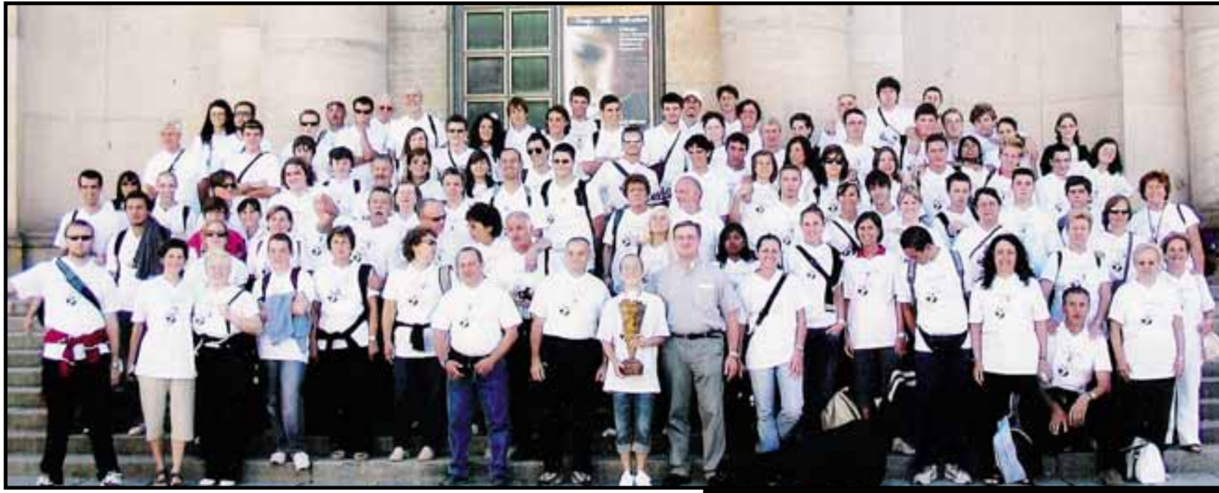
I partecipanti al pellegrinaggio del 2006 della chiesa di Paderno a Seriate