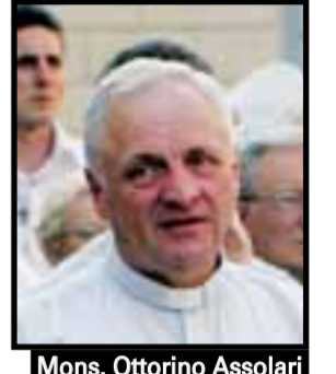
Mons. Ottorino Assolari

Primo vescovo della neonata diocesi composta da 21 parrocchie e con 17 sacerdoti e 21 seminaristi, monsignor Assolari ha maturato una grande esperienza in terra brasiliana. Per anni ha lavorato con il Brasile dalla Sacra Famiglia di Martinengo come vicario generale della Congregazione fino a quando 15 anni fa non è partito per lo Stato sudamericano per accompagnare due confratelli e non è più tornato. Ha fatto crescere come missionario Campo Mouraço, nello Stato del Paraná, a 2.500 chilometri a sud dello Stato di Bahia. Poi a 60 anni è stato chiamato a occuparsi della nuova diocesi istituita da papa Benedetto XVI ed è diventato il primo vescovo dell'ultrasecolare Congregazione di Martinengo cresciuta all'ombra della fondatrice Santa Paola Elisabetta Cerioli. Se la cattedrale è ancora da sistemare, sono già attivi il centro propedeutico per i seminaristi, ed è aperto il cantiere per il seminario. Attivo anche il centro per minori, anche se servono sempre i fondi per la gestione e la copertura delle spese di studio dei ragazzi e degli insegnanti. Pronto anche il centro polivalente in cui ci sono anche 26 stanze per accogliere i volontari che volessero dare una mano. Per contribuire all'opera di monsignor Assolari è possibile sostenere l'associazione «Apri il cuore onlus» con un bonifico bancario alla filiale di Gorle della Bipop con un versamento sul conto corrente 291251, Abi 05437 Cab 53100. Info: 035.662752.