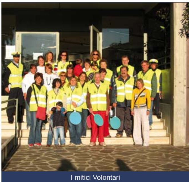
I mitici Volontari

Andare a scuola a piedi? Anche a Scanzo si può, da giovedì 5 ottobre, grazie all'iniziativa denominata " Piedibus ", nata dalla collaborazione tra l'Ufficio Scuola, la Polizia Locale, i Genitori e la Scuola Primaria "G. Pascoli".