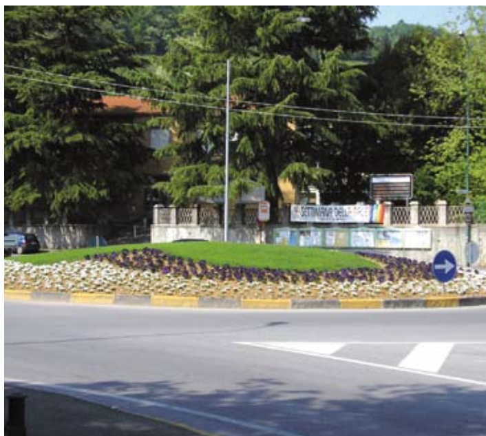
RONDO' PIAZZA CASLINI Polynt S.p.A.