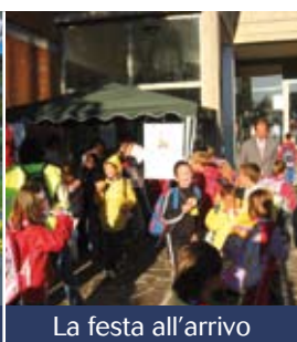
La festa all'arrivo