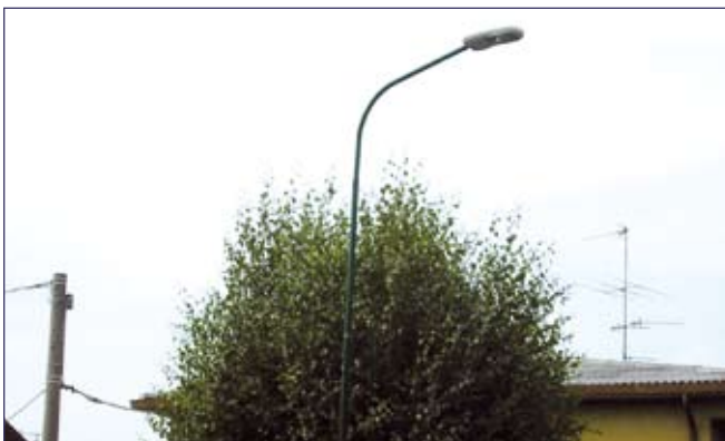
Ristrutturazione della rete d'illuminazione pubblica di via F.lli Cervi e zone limitrofe per 50.000 euro