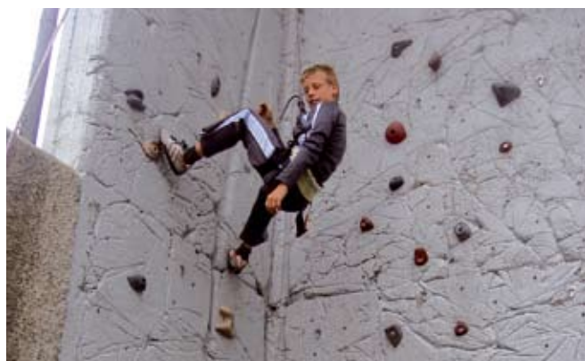
Corso di arrampicata