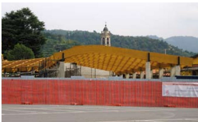
Nuovo centro sociale anziani con due campi da bocce al coperto e una cucina fissa per l'area feste