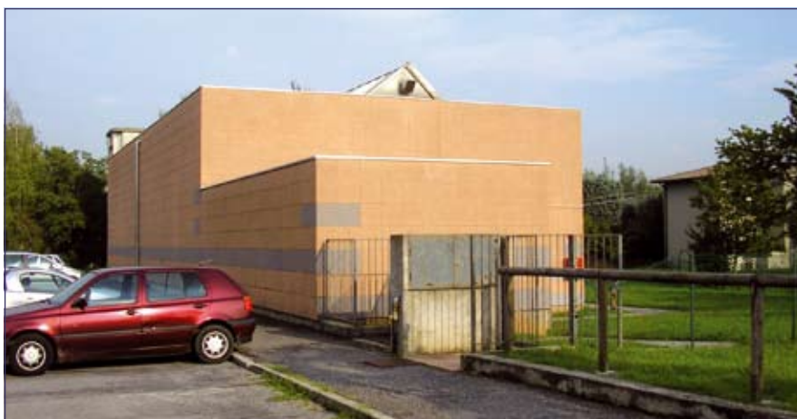
Polivalente: installazione sul tetto della palestra di Negrone di pannelli solari termici per 30.000 euro