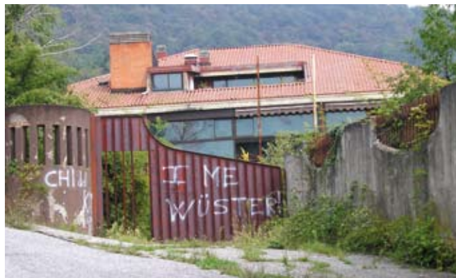
Risanamento area ex sporting club