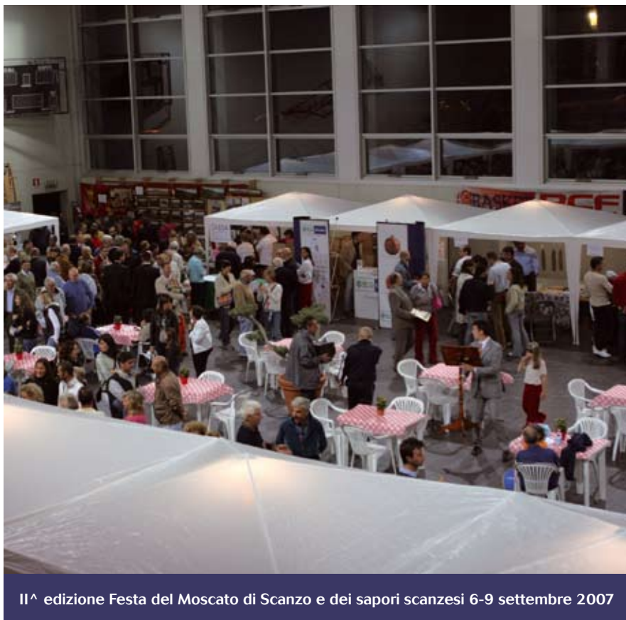
II a edizione Festa del Moscato di Scanzo e dei sapori scanzesi 6-9 settembre 2007