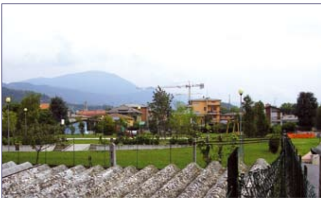
Via Puccini: realizzazione di un passaggio pedonale che collega via Puccini al Parco del Sole di via Galimberti