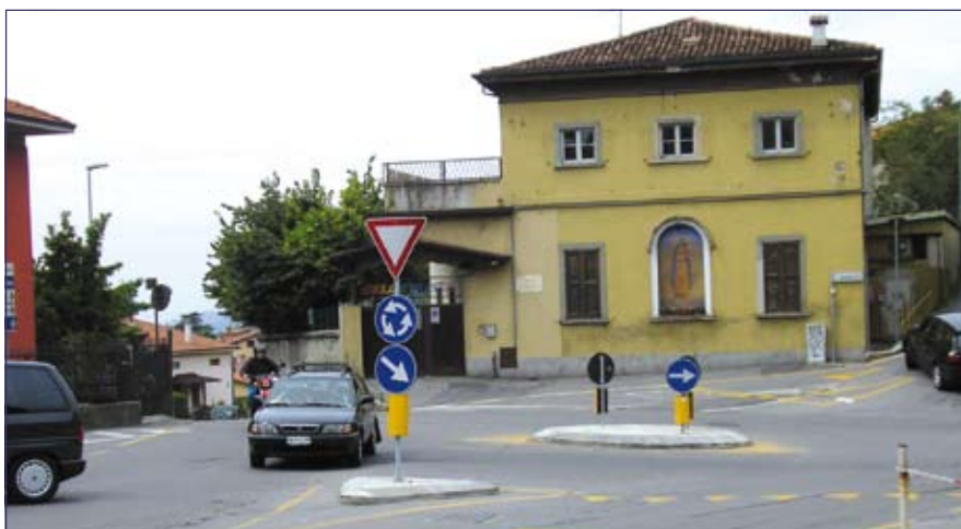
Completamento della Piazza di Tribulina. Lotto di asfaltatura stadi diverse di 50.000 euro

Colgo l'occasione per scusarmi con la cittadinanza se alcuni interventi di manutenzione "rapida" sono stati posticipati o sono stati comunque eseguiti con ritardo ma purtroppo la nostra squadra operai è composta solo da tre persone, un numero troppo limitato calcolando che il nostro Comune è di cinque frazioni, con quattro scuole, più di settanta chilometri di strade, tre cimiteri, ecc. Quest'anno abbiamo stanziato le risorse per assumere un nuovo operaio (negli scorsi anni non potevamo assumere nessuno perché vietato dal governo centrale) ma purtroppo coloro che finora hanno partecipato al concorso pubblico non sono stati in grado di superare le prove previste; mi auguro che presto troveremo un operaio all'altezza della situazione che possa integrare l'attuale squadra operai. ◆