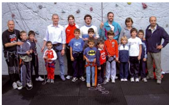
Foto di gruppo dei ragazzi del corso di arrampicata