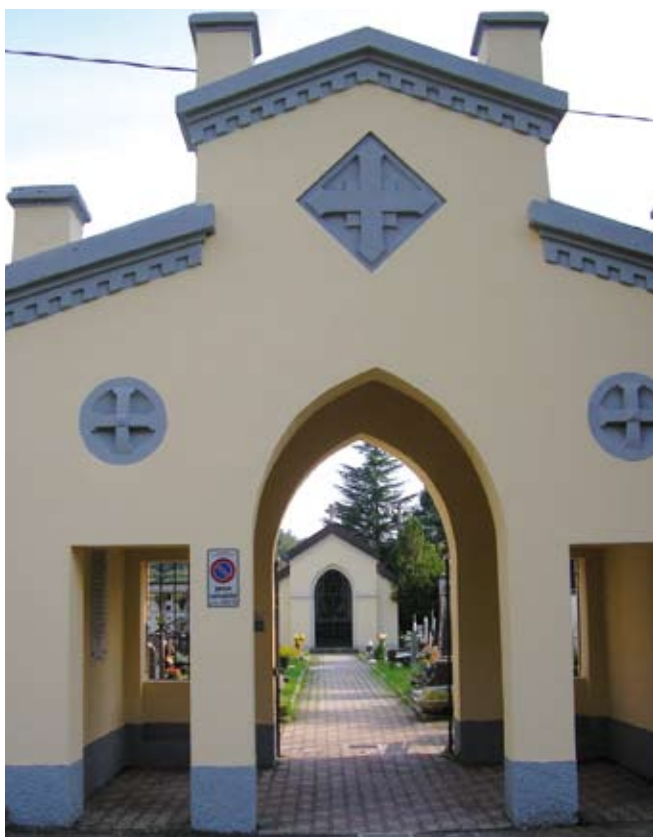
Ampliamento del cimitero di Gavarno