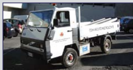
UN MEZZO ELETTRICO CHE NON INQUINA ACQUISTATO GRAZIE ANCHE AD UN CONTRIBUTO REGIONALE DI 15.000 EURO.