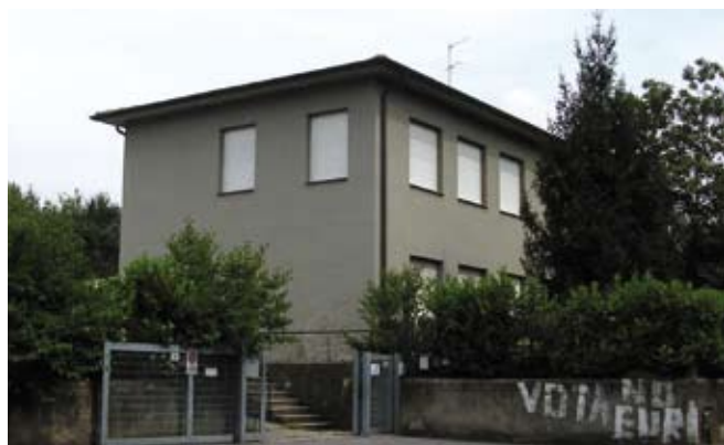
Nuovo asilo nido comunale