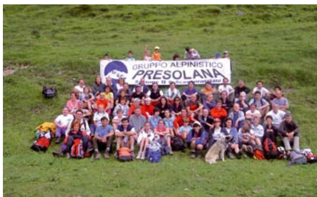
In Presolana per il compleanno del GAP