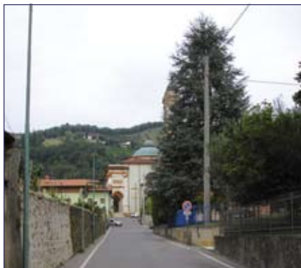
Sistemazione della fognatura di via Calvi

Dall'1 luglio 2007 la gestione del sistema fognario (manutenzione ordinaria e straordinaria, riscossione canoni di depurazione, ecc.) nonché la realizzazione di nuove fognature non saranno più di competenza del Comune ma di Uniacque.