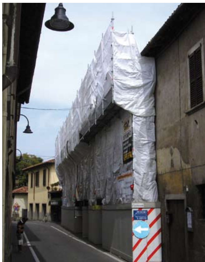
Ristrutturazione centro storico Scanzo Realizzazione struttura alberghiera