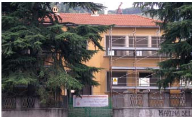
Nuovo poliambulatorio medico, nuova piazza civica, ampliamento municipio