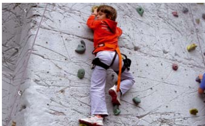
Corso di arrampicata