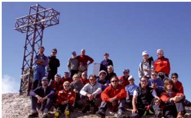
Foto Gruppo sulla Marmolada