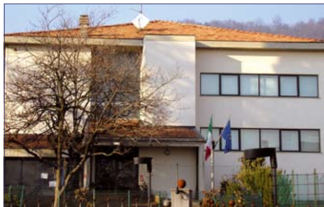
Scuole di Rosciate: manutenzione del tetto per 20.000 euro