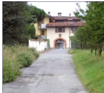
Realizzazione della fognatura di via Maffioli