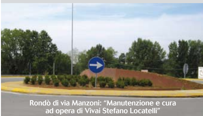
Rondò di via Manzoni: "Manutenzione e cura ad opera di Vivai Stefano Locatelli"