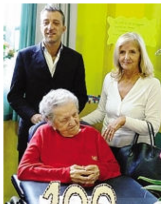
Il sindaco con Gilda: 100 anni