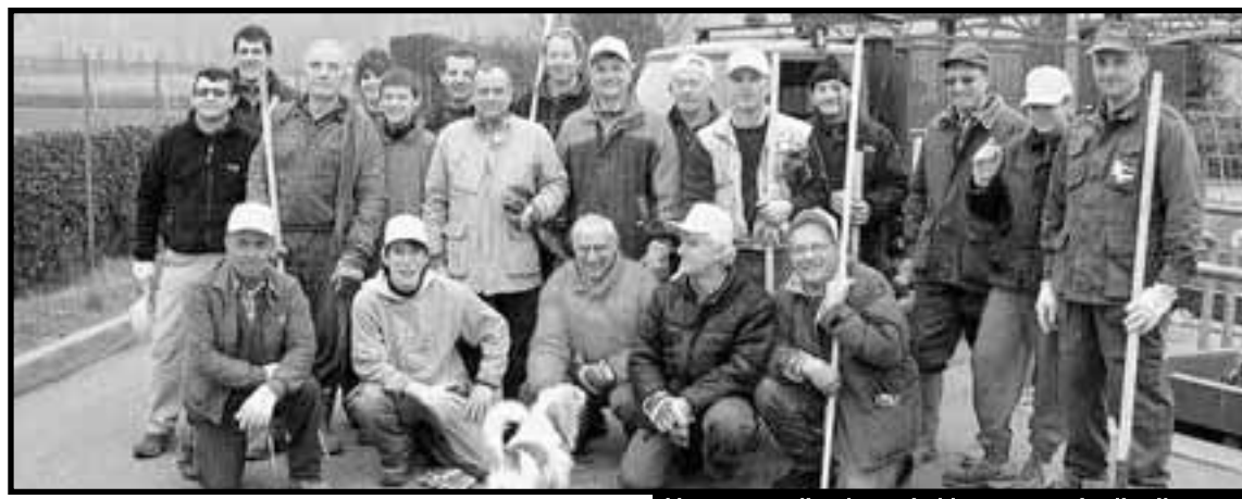
Un gruppo di volontari al lavoro per ripulire il paese