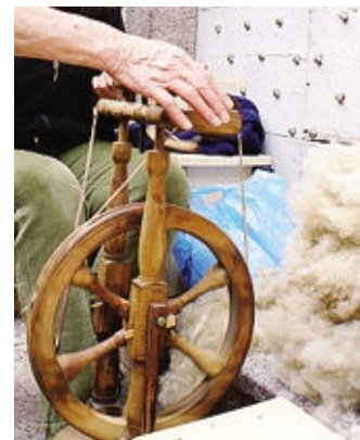
Tra le «materie» c'è la cardatura