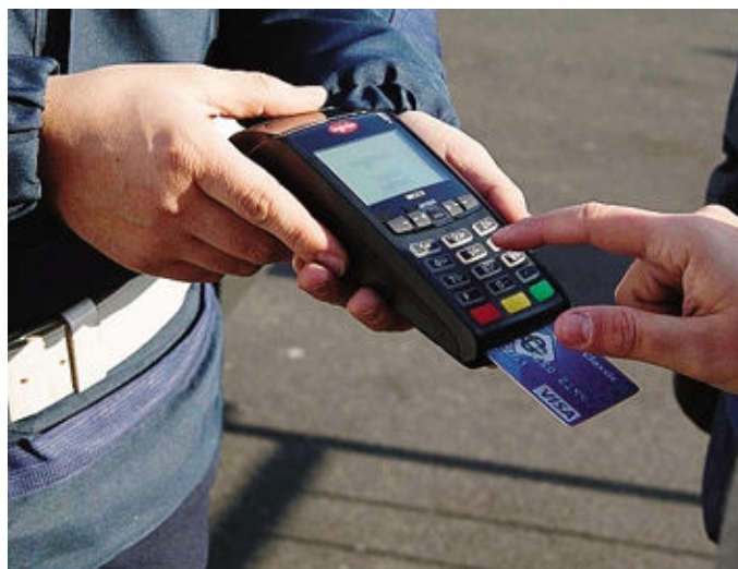
Scanzorosciate: le multe si pagano con bancomat e carta