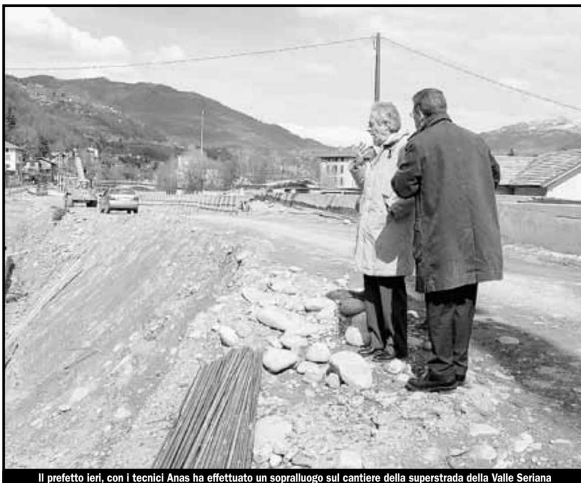
Il prefetto ieri, con i tecnici Anas ha effettuato un sopralluogo sul cantiere della superstrada della Valle Seriana

È promosso da un gruppo di commercialisti che sostengono il federalismo fiscale Nasce il Comitato antisprechi pubblici