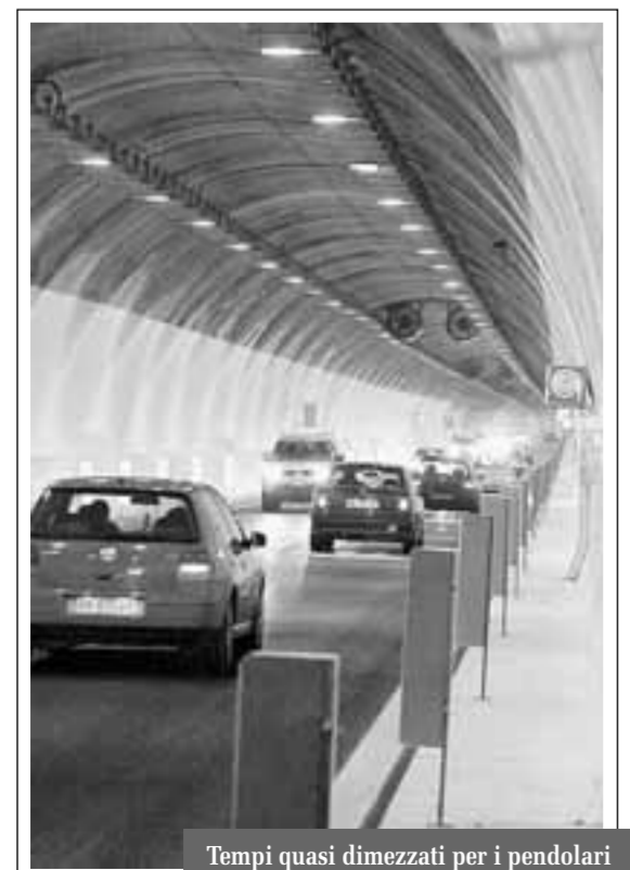
Tempi quasi dimezzati per i pendolari