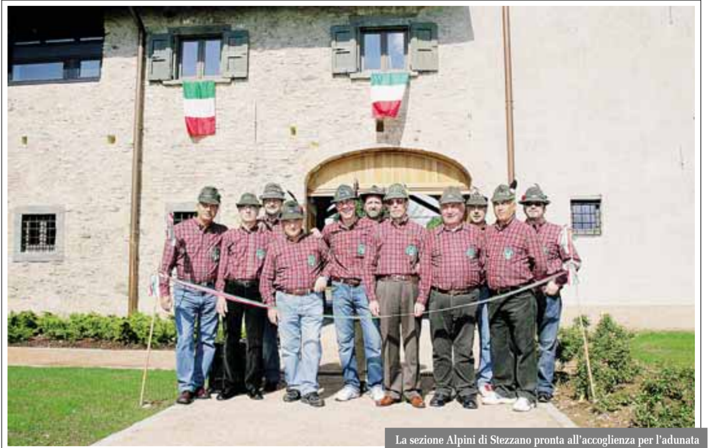
La sezione Alpini di Stezzano pronta all'accoglienza per l'adunata