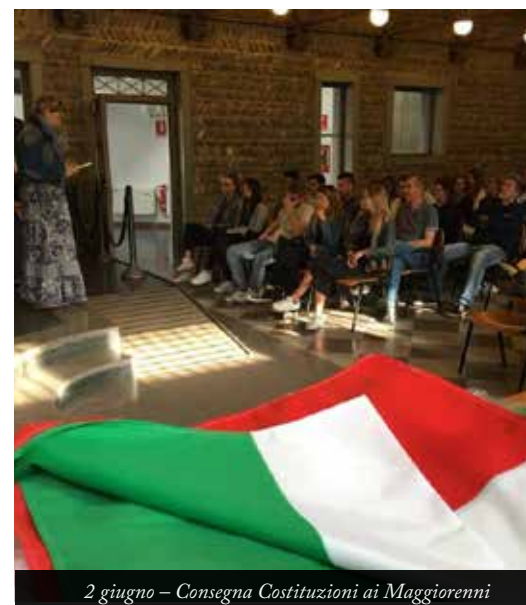
2 giugno – Consegna Costituzioni ai Maggiorenni

La scuola a Scanzorosciate è buona se è “pubblica”; ovvero diritto di tutti e patrimonio comune! Perché sia buona per davvero deve mirare al “pari” e alla maggiore qualità. Il solo dispari tollerabile è quello della convinzione, della determinazione, della dedizione di ciascuno nel migliorarsi giorno dopo giorno, mettendoci nell’apprendere, la grinta, la passione, la lucidità di chi vuole che ogni giornata scolastica sia per davvero “Il giorno prima della felicità” per sé e per ogni alunno di Scanzorosciate.