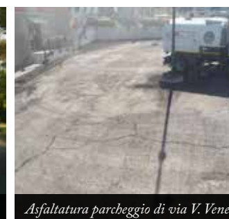
Asfaltatura parcheggio di via V. Veneto