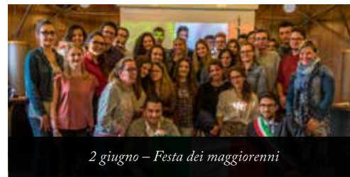
2 giugno - Festa dei maggiorenni

GRAZIE a tutte le persone che a vario titolo lavorano e collaborano nelle scuole e negli asili e che con passione si sono prese carico dei nostri bambini e ragazzi per un anno intero e che ora si godono il meritato riposo estivo.