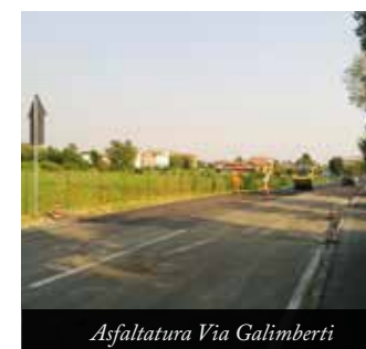
Asfaltatura Via Galimberti

marciapiedi sulla via Valle Gavarnia, via Monte Negrone, via Fiobbio, Corso Europa, Via don Pezzotta e sostituendo dove necessario le cordonature. A seguire metteremo in sicurezza gli attraversamenti di via F.lli Cervi e via Matteotti così come l'attraversamento della piazza di Tribulina procedendo verso Gavarno. Mantenendo monitorato il territorio interverremo anche a risanare quelle porzioni di strada che non hanno bisogno di un intervento esteso ma piuttosto mirato a dei singoli rappezzi così da rendere le strade il più sicure possibile.