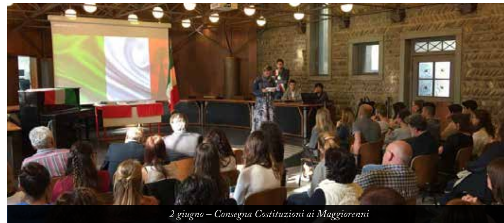
2 giugno – Consegna Costituzioni ai Maggiorenni

Serietà, precisione, onestà, lealtà: questo è il Piano di valori su cui si basa nostro “Piano di diritto allo studio”. Poi i contenuti e i contributi. Ultimi questi ma significativi in termini economici! Numeri che esprimono lo sforzo per sostenere e soddisfare interventi che vanno dal contenimento delle rette del Nido comunale, alle risorse stanziare per le scuole dell’infanzia, al sostegno a favore di ragazzi diversamente abili, alla proposta di progetti in diversi ambiti e classi, Borse di Studio per valorizzare e stimolare il talento dei nostri ragazzi.