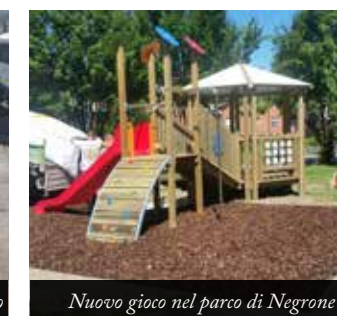
Nuovo gioco nel parco di Negrone