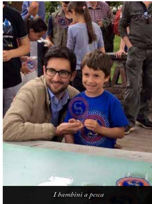
I bambini a pesca

hanno sottoscritto un accordo per unire servizi ed essere più efficaci ed efficienti.