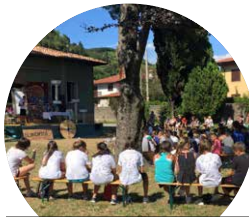
C.R.E. Interparrocchiale 2016

lo abbiamo fatto con la presentazione di esibizioni e prove di attività come judo, aikido, ginnastica artistica, danza classica, hip - hop e aerodance. Ma la nostra estate di sport non è stata solo questo, ricordiamo la camminata "Staffetta sul Serio" - di cui abbiamo ospitato la partenza - organizzata in sinergia con altri Comuni limitrofi e l'iniziativa del cre sportivo per i più piccoli : "Un mare di sport", realizzata grazie alla preziosa collaborazione e disponibilità della sportiva U.S. Scanzo.