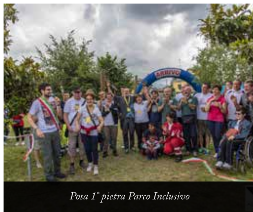
Posa 1° pietra Parco Inclusivo

GRAZIE a tutte le associazioni di Scanzorosciate che dopo un anno di lavoro di "messa in rete" hanno organizzato la "1° camminata del Volontariato" che simbolicamente ha significato anche