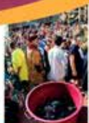
Il fascino del PALIO DEL MOSCATO