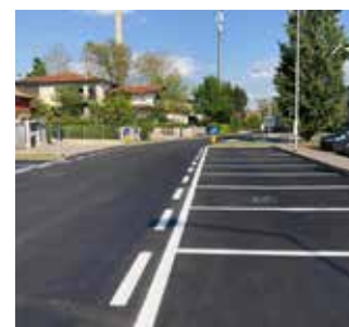
via Carlo Alberto Dalla Chiesa

A seguire lavori di realizzazione pista ciclopedonale via Aldo Moro.