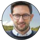
Davide Casati Sindaco con delega al bilancio, sicurezza, urbanistica e personale