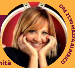
ORE 21.30 PIAZZA ALBERICO