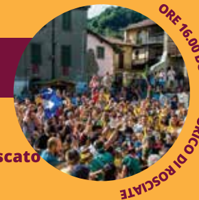
ORE 16.00 BORGO STORICO DI ROSCIATE

• Tutti i giorni area giochi con gonfiabili presso l'Oratorio •