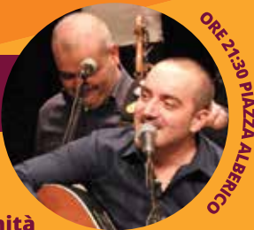
ORE 21.30 PIAZZA ALBERICO