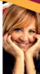
La comicità di DEBORA VILLA