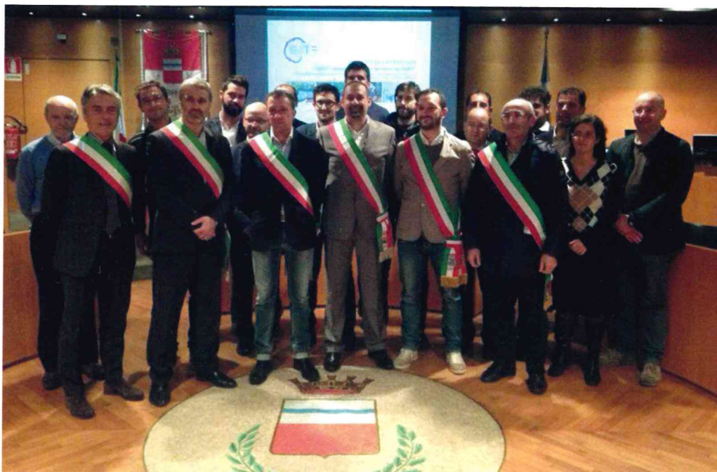
Nasce GATE, il Distretto dell'Attrattività più esteso della provincia in vista di Expo 2015

re il taglio dei trasferimenti statali previsti dal Parlamento nella Legge Finanziaria 2015. Risparmio che si aggiunge a quello delle utenze della pubblica illuminazione, infatti grazie all'investimento comunale effettuato sull'intera rete si avrà una riduzione delle bollette di circa il 23% .