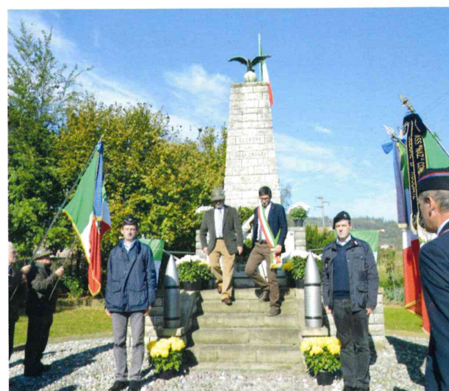
Commemorazione del IV novembre al monumento dei Caduti di Negrone