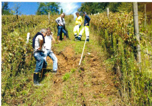
Smottamento vigneto di Negrone