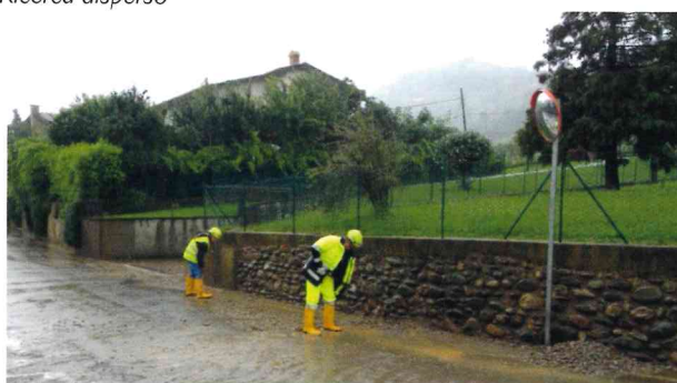
Agosto - Interventi emergenza bombe d'acqua