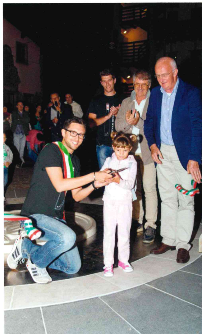
Inaugurazione nuova piazza Alberico da Rosciate

Sul fronte finanziario il bilancio di Scanzorosciate è solido e sano e siamo riusciti nel 2014 a garantire tutti i servizi impostati nel passato e attivarne anche di nuovi (penso all'importante novità dello "Sportello Lavoro", all'esperimento dello spazio gioco in biblioteca per i bimbi 0-36 mesi, alle tante e nuove iniziative culturali e scolastiche organizzate dai nuovi assessori); grazie inoltre all'estinzione anticipata di un mutuo di 336.089 euro abbiamo ridotto al minimo il livello di indebitamento del Comune con un risparmio per l'anno nuovo di 93.447 euro , risorse che speriamo servano per compensa-