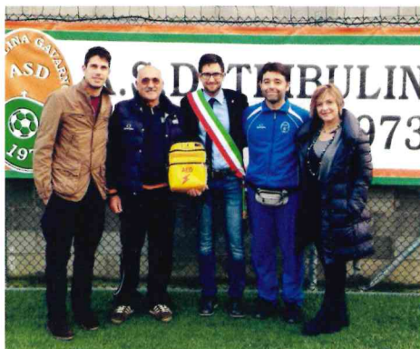
TRIBULINA: Consegna del defibrillatore all'ASD Tribulina Gavarno. Il corso di formazione degli allenatori sarà finanziato dal Club Atalanta Tribulina