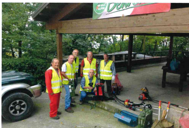
Settembre - Pulizia chiesina Alpini