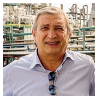
Presidente Polynt Rosario Valido

noi con prodotti finiti molto competitivi». Valido non vuole percorrere a ritroso certi passaggi industriali, però manca al momento una soluzione: «Chiaro che non vogliamo tornare ai tempi delle polveri nere nelle città, ma come facciamo ad andare avanti e salva-