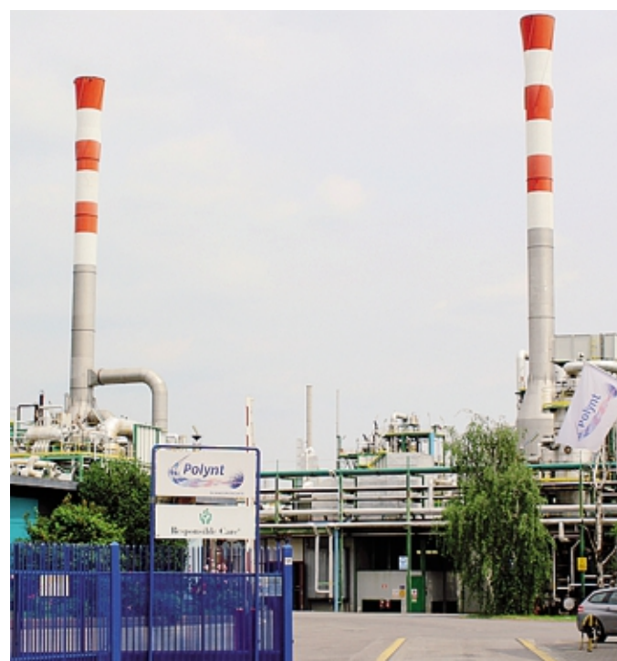
La sede della Polynt a Scanzorosciate occupa circa 450 dipendenti

Una situazione insostenibile, «che ha portato alcuni prodotti completamente fuori mercato», ha spiegato come potrebbe esserci la possibilità di utilizzare prodotti energetici alternativi, quali materie prime diverse dal metano, «ma le attuali leggi nazionali, regionali o provinciali, non ne permettono l'utilizzo e la rigidità nell'applicazione di tali leggi non consente flessibilità alcuna mentre, in altri Paesi produttori, invece, usano persino il carbone o altri fossili iper-inquinanti e poi arrivano da