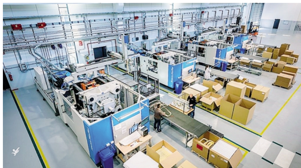
La Castelcrom conta 130 dipendenti e un fatturato di circa 15 milioni

prossimi al punto di pareggio. Per il secondo trimestre 2022 la nostra azienda aveva usufruito di un bonus del 20% sull'energia, invece per questa seconda parte dell'anno il governo ancora non ha messo in atto nuove strategie per aiutare le imprese». Come in tante altre aziende, Castelcrom sta stringendo i denti pur di restare sui binari della normalità. «Abbiamo provato a proporre un ritocco dei listini, ma ci siamo sentiti rispondere picche: i clienti minacciano di trasferire le nostre produzioni altrove nel caso di un adeguamento tariffario, perché le case automobilistiche hanno concesso pochissimo margine di aumento alla filiera».