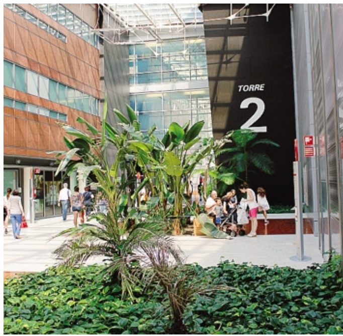
La donna è ricoverata all'ospedale Papa Giovanni

«Di quel momento ho ricordi confusi - spiega - ma so che prima è intervenuta la segretaria del direttore facendo il massaggio cardiaco, poi un collega con un defibrillatore e nel frattempo gli altri chiamavano i soccorsi. Un vero e proprio gioco di squadra». Trasportata all'unità di emodinamica del Papa Giovanni è stata subito operata: le hanno tolto un trombo e messo uno stent. Pian piano si sta riprendendo, nonostante la normale debolezza: «Lavoro a Curno da poco tempo ma mi trovo benissimo con tutti i colleghi, c'è un bellissimo clima e posso dire che sul posto di lavoro mi sento a casa. Il giorno in cui sono stata male è venuto a trovarmi anche il direttore e continuo a ricevere