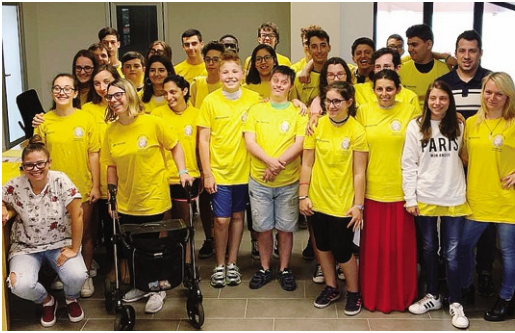
I giovani che partecipano ai Cantieri Estivi ad Azzano San Paolo

I ragazzi verranno anche coinvolti nell'organizzazione della Notte Giovane, l'evento dell'estate azzanese che si terrà sabato primo settembre,