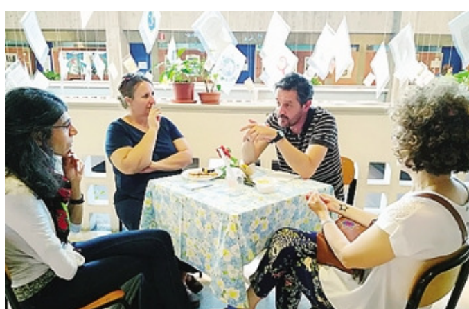
La biblioteca vivente organizzata dai bambini di Paladina

personali, emozionanti e soprattutto vere. Appassionanti storie di viaggio: per esempio in Transiberiana nella sconfinata Russia oppure per volontariato da Parigi ai Caraibi. E poi storie di passioni per lo sport, per l'arte, per la danza, per la scrittura, per i propri animali. Ma anche storie di uomini in missione: chi per salvare una campana dal terremoto e chi per salvare un uomo che sceglie di vivere per strada. Ventidue tavolini allestiti dagli studenti di quinta e distribuiti nell'agorà delle scuole medie (le elementari erano presidiate dai seggi elettorali) trasformata per