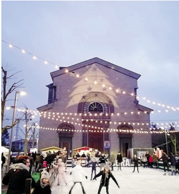
Torna il pattinaggio a Scanzo. Qui un'immagine dell'ultima edizione

A corredo, laboratori creativi a tema natalizio per bambini e bancarelle di dolcetti tipici e giocattoli. Ma soprattutto la pista di pattinaggio su ghiaccio al coperto, allestita in Piazza Mons. Radici: è il fiore