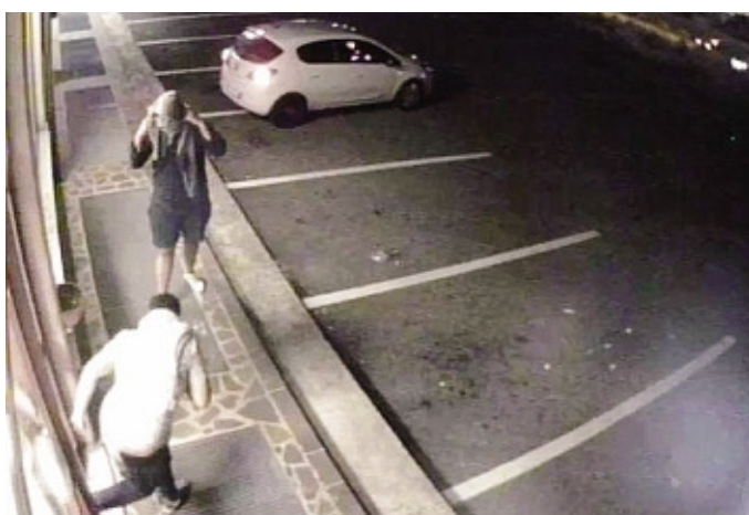
Due malviventi ripresi a Gorlago: con un calcio viene forzata la porta

La notte successiva, non solo la banda bisca il colpo, ma ne mette a segno ben due, in altri punti vendita della catena, in largo Marconi 4 a Brusaporto e in via Borghetto 1 a Torre Boldone. La dinamica è praticamente la stessa, anche se negli ultimi due furti la banda sembra più violenta, sia nello scassinare le porte d'ingresso delle lavanderie, sia nel manomettere le casse automatiche. Infatti, mentre il bottino è all'incirca lo stesso per tutti e tre i raid - 600 euro -, i danni materiali sono più ingenti a Brusaporto e a Torre Boldone (la società è comunque per fortuna assicurata). «Nella migliore delle ipotesi questi furti ci costeranno 8 mila euro, nella peggiore