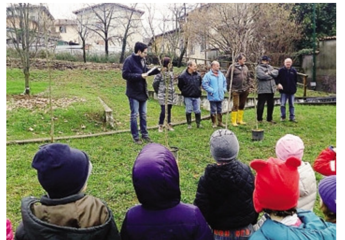
La Festa dell'albero nel giardino della scuola di via degli Orti