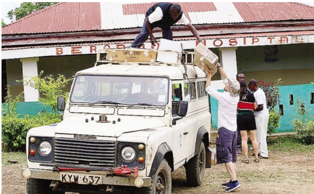
La consegna a Nyagwehe dei farmaci acquistati con i proventi della «Black Night Run» 2017

Dopo la scomparsa di Pini due anni fa è nata l'Associazione Franco Pini onlus con l'obiettivo di dare continuità all'opera del fondatore. L'obiettivo fondamentale resta il sostegno allo sviluppo socio-economico di Nyagwehe (Kenya), mantenendo in vita quanto già avviato