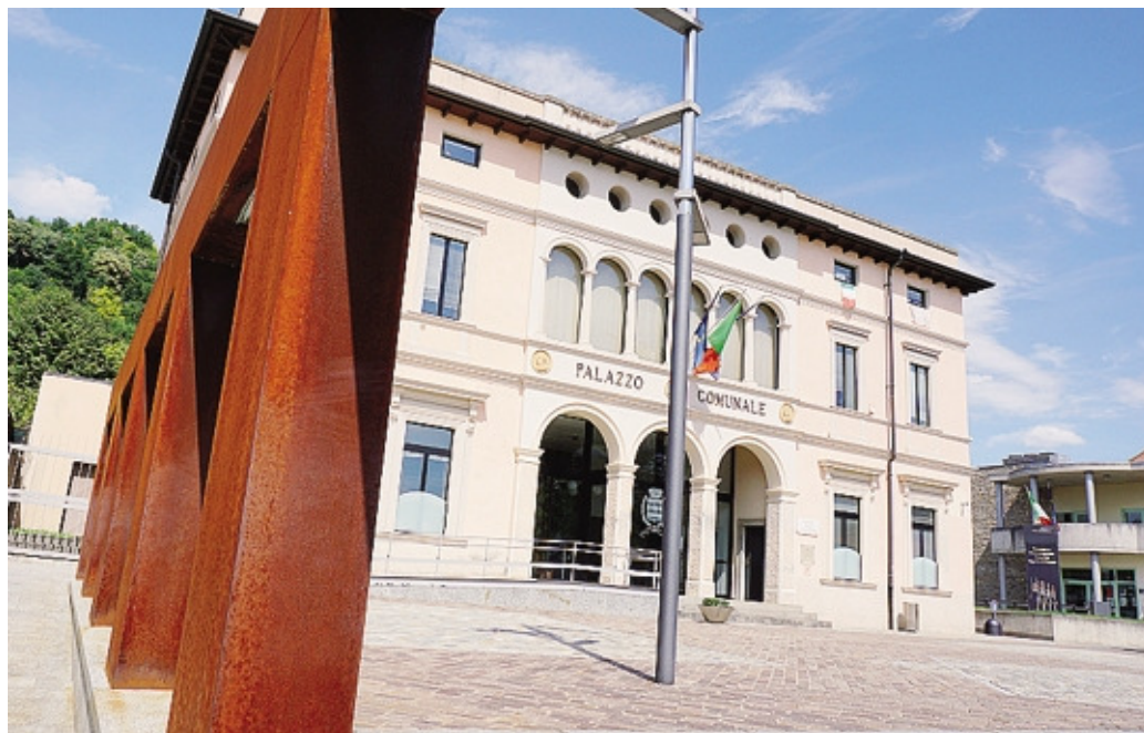
Il Comune di Scanzorosciate ha attivato uno sportello unico digitale per l'edilizia

Grazie a CPortal il Comune si attiene al rispetto delle normative relative all'amministrazione digitale, alla semplificazione e alla trasparenza amministrativa, così come indicato dalle ultime disposizioni del 2014 tese ad accelerare sui servizi on line e sul processo di digitalizzazione delle amministrazioni pubbliche. In materia di trasparenza e semplificazione, le linee guida de-