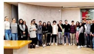
I giovani premiati

Premiare il merito in modo tangibile. È la scelta del Comune di Torre Boldone che, da oltre dieci anni, istituisce borse di studio per gli studenti delle supe-