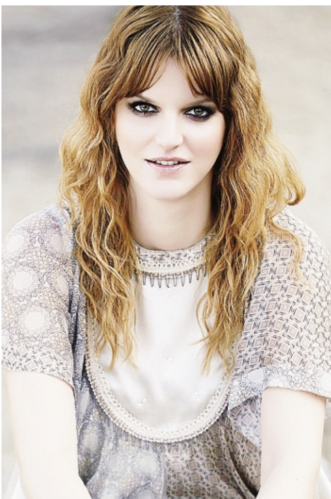
Chiara Galiazzo si esibirà nella serata conclusiva di Treviva