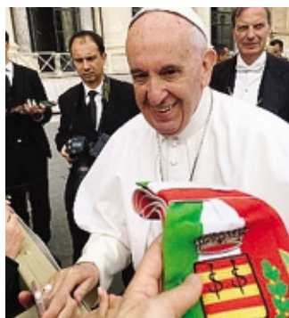
Papa Francesco con la fascia del sindaco di Scanzorosciate

Il primo cittadino ha raggiunto il Vaticano insieme ad alcuni volontari dell'associazione «Amici del Moyamoya» di Scanzo, che si impegna per raccogliere fondi e promuovere progetti per la cura di questa rara malattia cerebrovas-