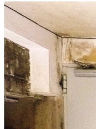
L'ingresso alle cantine derubate

Anche in corso Roma, così come era accaduto due notti prima in via Puccini, nessuno degli inquilini si è accorto di nulla durante i furti: i ladri hanno agito nel cuore della notte e i colpi sono stati scoperti nella mattinata di ieri, tra lo sconforto generale degli abitanti dei palazzi al civico 72. Identico il modus operandi