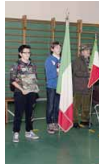
La cerimonia alla «Nullo»