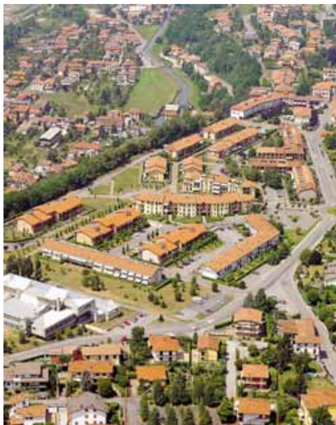
Una veduta aerea dell'area tra i territori dei Comuni di Paladina e Valbrembo