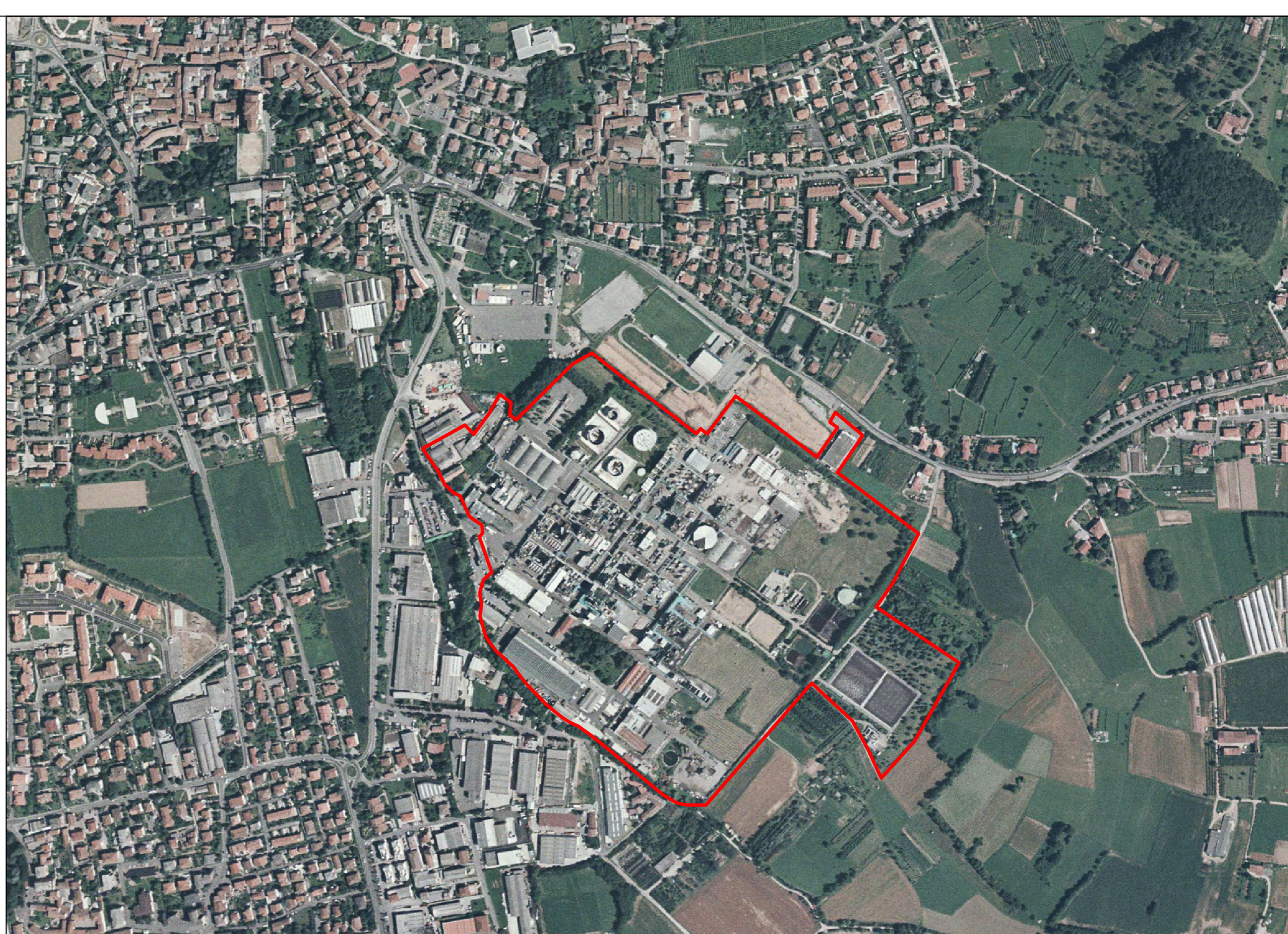
AEROFOTO - area Polynt S.p.A. SCALA 1:5000 - delimitazione dell'area di stabilimento

Acque & Energia Progettazioni tecniche - Studi ingegneristici e fiscali Progettazioni, indagini, certificazioni per risparmio ed efficienza energetica Ingegneria per l'ambiente e territorio